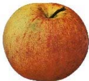
Apples of New York, 1905.

ORIGINE : Ohio, USA, 1848. Importée en 1849 par André Leroy d'Angers. Conservée à Brogdale (the book of apples, 1993, p.254). A été cultivée en Australie, Nouvelle-Zélande, France ou on en trouve encore.